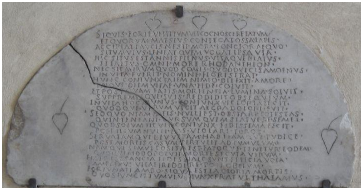
Abb. 2: CIL VI 13732, Palazzo Barberini, Rom